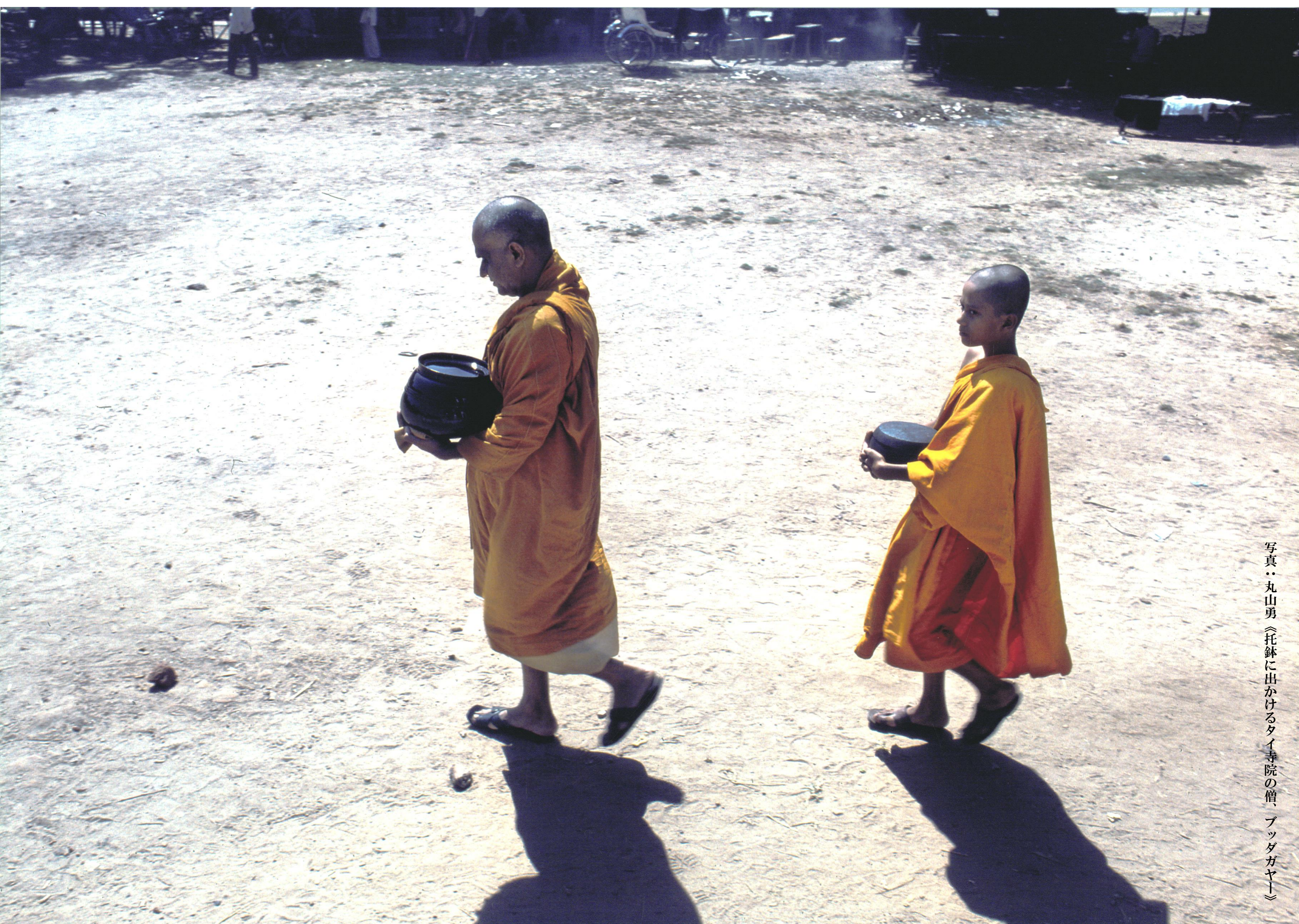
写真：丸山勇《托鉢に出かけるタイ寺院の僧、ブツダガヤト》

「日本文人の上海体験 - 増田渉と魯迅を中心に」 内藤忠和 (島根大学法文学部)