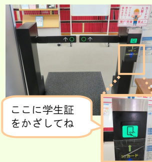
ここに学生証をかざしてね