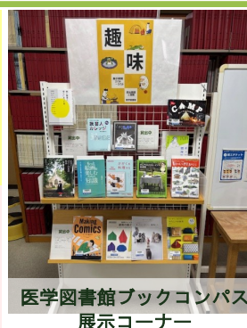
医学図書館ブックコンパス 展示コーナー