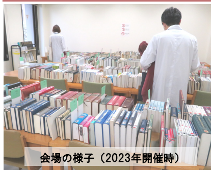
会場の様子（2023年開催時）

医学図書館では、重複や改版などのために不用になった旧蔵書や雑誌を、学生・教職員などの皆さんに無償提供する会を開催します。ぜひご来場ください。