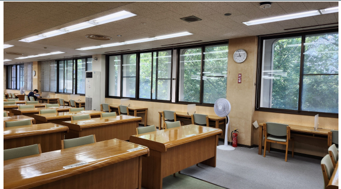
窓掃除後の閲覧室

作業期間中、作業に伴う音の発生や座席の移動などについて、利用者の皆様にご理解・ご協力いただき、ありがとうございました。