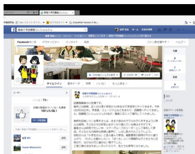
図書館コンシェルジュ Facebook ページ

私たち図書館コンシェルジュは、活動内容の広報の方法として Facebook を使っています。更新頻度はまだ少ないですが、主な活動について情報発信しています。Facebook に登録している人はもちろんですが、登録していなくても図書館ホームページのトップから見る事ができます。お得な情報や楽しい情報がのっていますので、ぜひご覧ください。(富室)