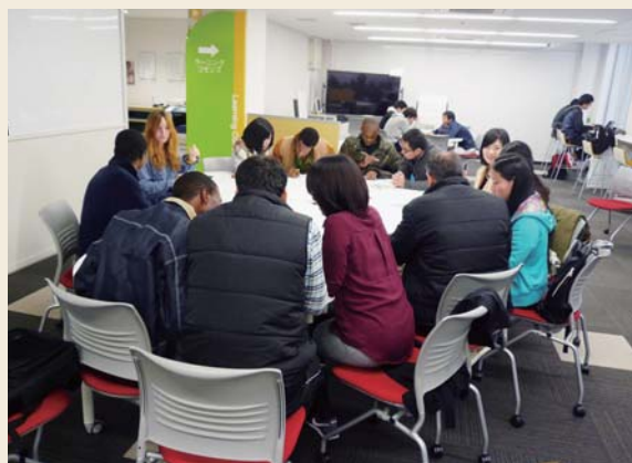
「ただ日本語で話すだけ」の様子 (本館/ラーニングcommons)

医学図書館では、ICカードによる認証を受けることで閉館後も24時間入館できます。