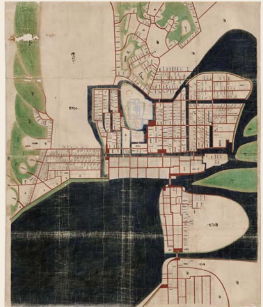
堀尾期 松江城下町絵図

1808(文化5)年刊行『医範提綱』の付録であり、亜欧堂田善による日本最初の銅版解剖図として知られています。