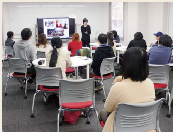
「ラーコモカフェ」の様子 (本館/ラーニングcommons)

2011(平成23)年度以降は、同様の取り組みを行っている近隣の大学と協力して、学生協働シンポジウムを年に1回開催しており、全国的にも注目を集めています。