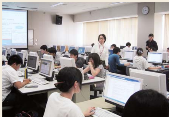
「文献検索講習会」の様子 (医学図書館)

学部1年生に対しては全員に図書館ガイダンスを実施しています。このほかにもデータベースの利用方法などのテーマで講習会を開催しています。