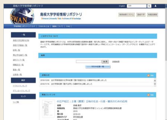
島根大学学術情報リポジトリ「SWAN」

この事業は2008（平成20）年度から2012（平成24）年度まで、国立情報学研究所の委託を受けて当館が代表機関として推進してきました。全国の国立大学図書館や自治体の協力のもと事業は拡大し、その成果は2015（平成27）年度に奈良文化財研究所が公開した「全国遺跡報告総覧」に引き継がれています。