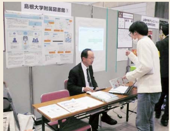
「しまね大交流会」に出展した様子

「地域未来創造人材の育成を加速するオールしまね協働事業」(COC+事業)の一環として開催されている「しまね大交流会」で図書館の取り組みを紹介するブースを出展しています。また2016(平成28)年度からは館内に「地域コミュニティラボ」を開設しています。