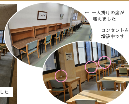
一人掛けの席が増えました