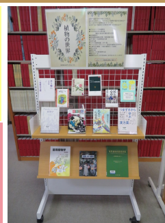
医学図書館 ブックコンパス 展示コーナー

新入生の皆さま、ご入学おめでとうございます。皆さんの中には、受験の際に初めて島根県を訪れたという方も多いのではないのでしょうか。今回は新天地での生活の一助となるべく、出雲、そして島根県に関連する図書をまとめてみました。何かと忙しい季節ではありますが、本を通じて、島根県の魅力に触れてみてください。