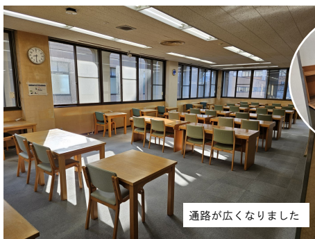
通路が広くなりました