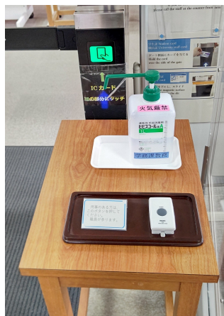
木製トレイを設置して、台の上がすっきりした印象になりました