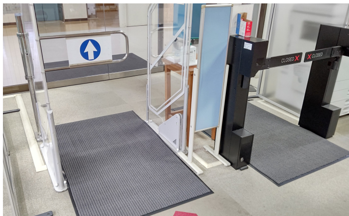
三枚のマットを同じ色に揃えました

ささやかなイメージチェンジですが、いつも図書館を利用されている皆様は変化にお気づきでしたか？ 普段は通り過ぎるだけの場所という方も多いと思いますが、新鮮さを感じていただければ幸いです。