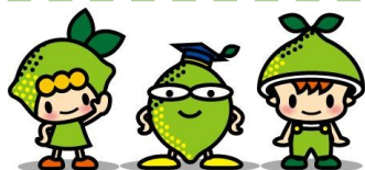
みいなちゃん ライム博士 けんさくくん

ひっそりと活動している附属図書館のキャラクターです。インフォ・アクセスにもちょこちょこ登場します。