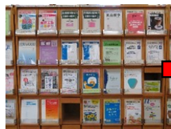
【 Before 】