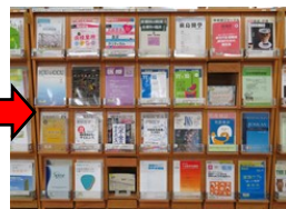
【 After 】