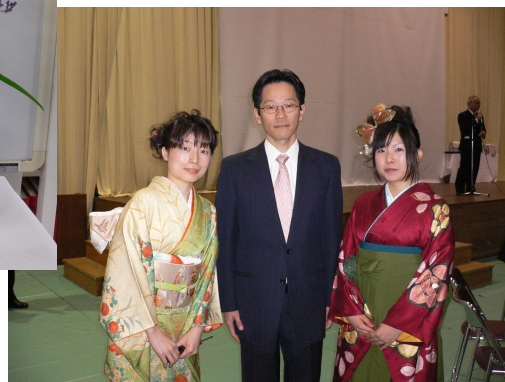
北垣分館運営委員と卒業生代表