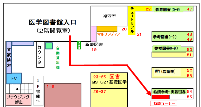
特設コーナー配置図