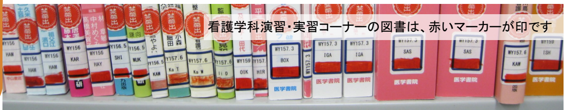
看護学科演習・実習コーナーの図書は、赤いマーカーが印です