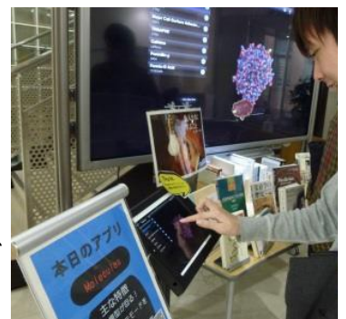
徳島大学附属図書館蔵本分館にて医療系無料アプリを紹介する展示の様子

当館職員も研修に励み、新しいコンテンツを利用者の皆様に提供していきたいと思っております。