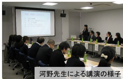
河野先生による講演の様子

http://www.lib.shimane-u.ac.jp/9/itokon/