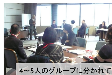
4~5人のグループに分かれて

この研修会のテーマは「会議が変われば組織が元気になる」で、5つのグループに分かれて実習を中心に進められました。会議は準備が重要であることを確認したり、意見を多く引き出すために傾聴の練習をしたり、出された意見を「見える化」するためにホワイトボードや付箋の効果的な使い方を実践したり、多数決ではない合意形成の方法を学んだりしました。今後は日々の業務でも実践を重ねることで、学んだことを身につけて、よりよい会議進行、組織運営、業務改善に活かしていきたいと思えます。