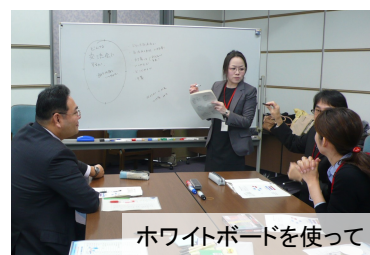
ホワイトボードを使って